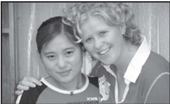
Gods liefde met elkaar delen, wat is er nou mooier dan dat?

Al vroeg staan we de volgende dag op en gaan per riksja, taxi en bus naar het station. Na ongeveer een halve dag maïsvelden te hebben gezien, arriveren we in het stadje waar we moeten zijn. We worden opgewacht door enkele gemeenteleden en worden per taxi naar een restaurant gereden. Daar zouden wij wachten op onze contactpersoon. Deze bracht ons op de hoogte van de laatste ontwikkelingen en vertelde ons dat de groep aan wie we de eerste twee dagen les zouden geven naar huis was gegaan om veiligheidsredenen. Het is namelijk verboden